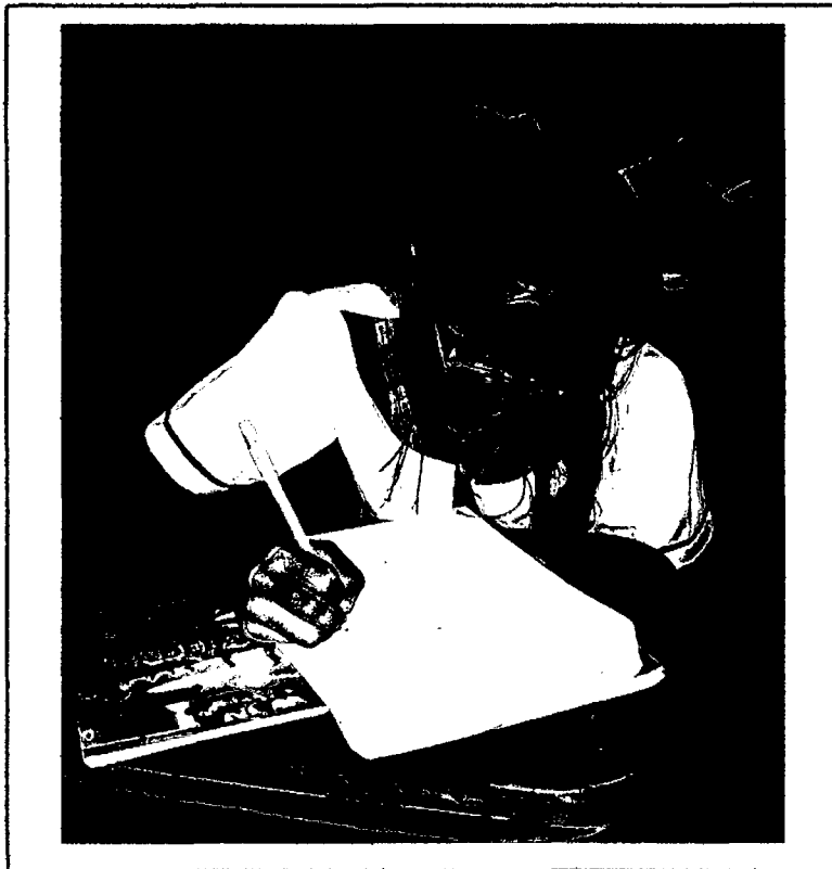
Estudiantes de la Institución Educativa "Cleofe Arévalo del Águila", respondiendo la encuesta de la tesis "Inteligencia Emocional y su relación con el Rendimiento Académico" - 2010