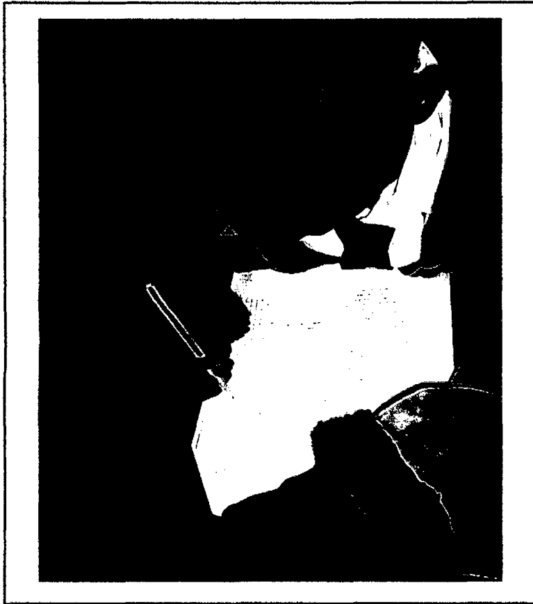
Estudiantes de la Institución Educativa "Cleofe Arévalo del Águila", respondiendo la encuesta de la tesis "Inteligencia Emocional y su relación con el Rendimiento Académico" - 2010