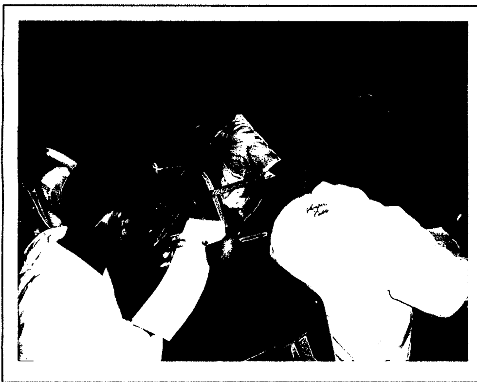
Estudiantes de la Institución Educativa "Cleofe Arévalo del Águila", respondiendo la encuesta de la tesis "Inteligencia Emocional y su relación con el Rendimiento Académico" - 2010