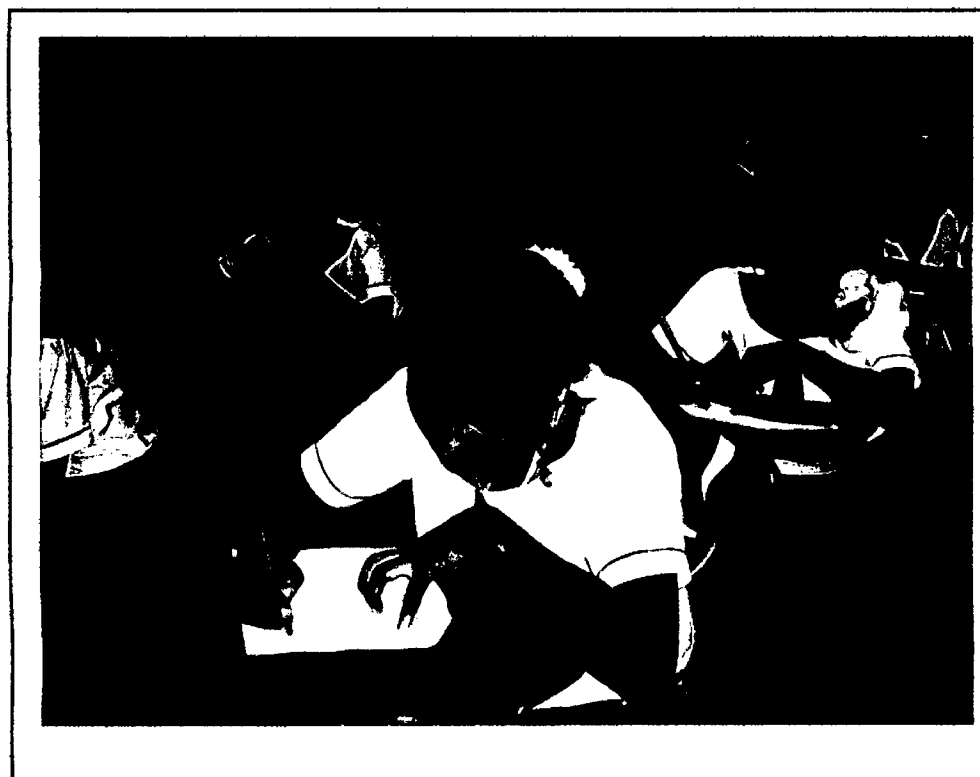
Estudiantes de la Institución Educativa "Cleofe Arévalo del Águila", respondiendo la encuesta de la tesis "Inteligencia Emocional y su relación con el Rendimiento Académico" - 2010