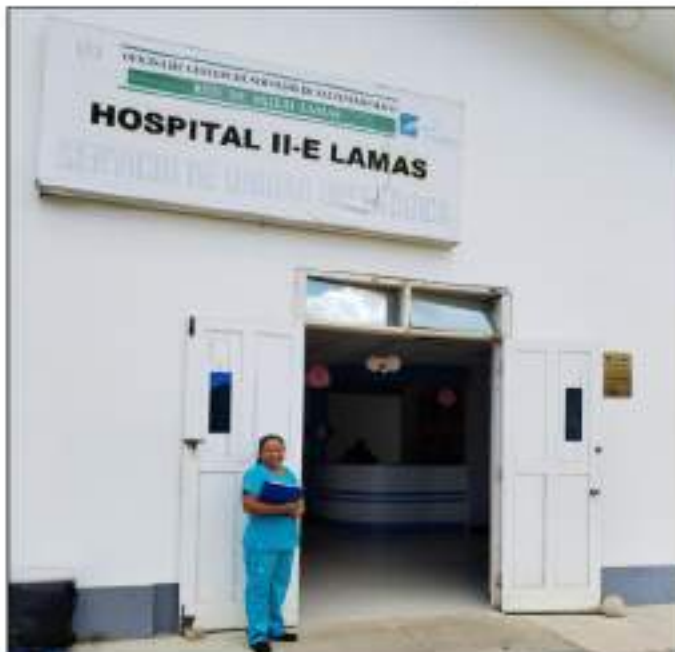
ENTRADA AL HOSPITAL II - E LAMAS