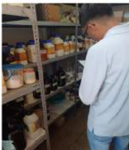
Figura 11 Inventario de reactivos