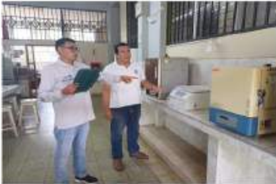
Figura 6 Investigador con el Técnico de laboratorio