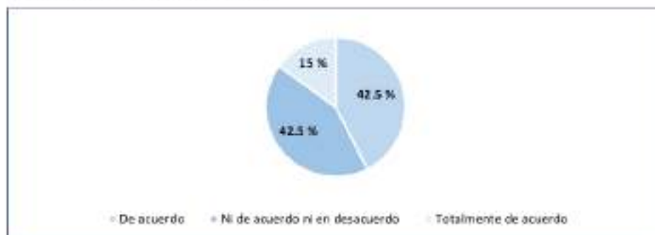
Figura 2 Disponibilidad de equipos