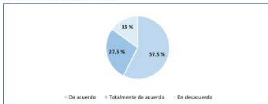
Figura 5 Seguridad dentro del laboratorio

5. Me siento seguro(a) cuando trabajo dentro del laboratorio de química debido a sus condiciones y equipamiento.