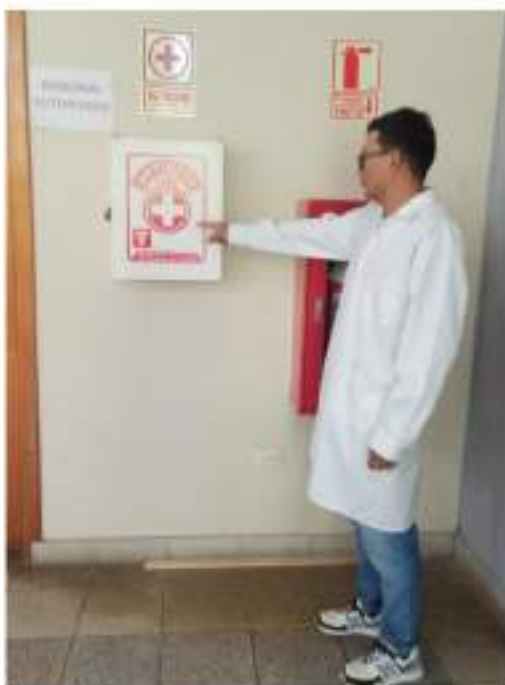
Figura 13 Inspección de botiquín, señalización y extintor