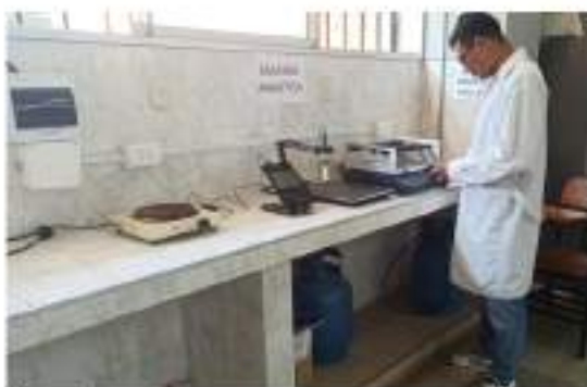
Figura 9 Verificación de los equipos