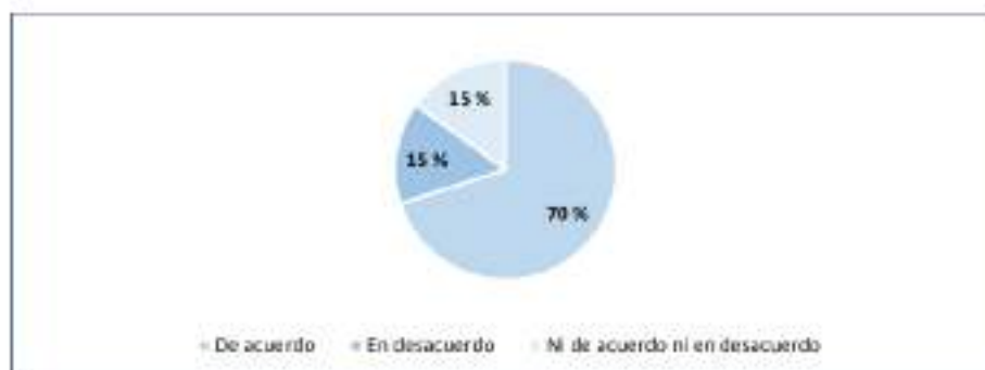
Figura 3 Normas internas Interpretación: