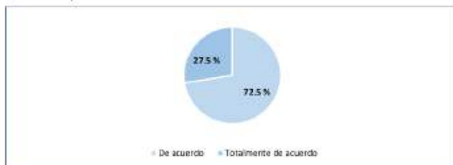
Figura 4 Condiciones del laboratorio:

4. El laboratorio cuenta con las condiciones necesarias de orden y limpieza para realizar las prácticas adecuadamente.