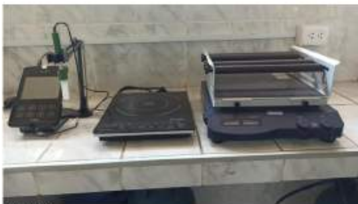
Figura 12 Equipos de laboratorio