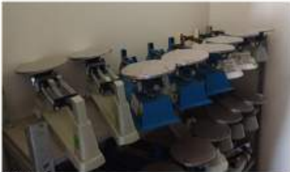
Figura 7 Balanzas