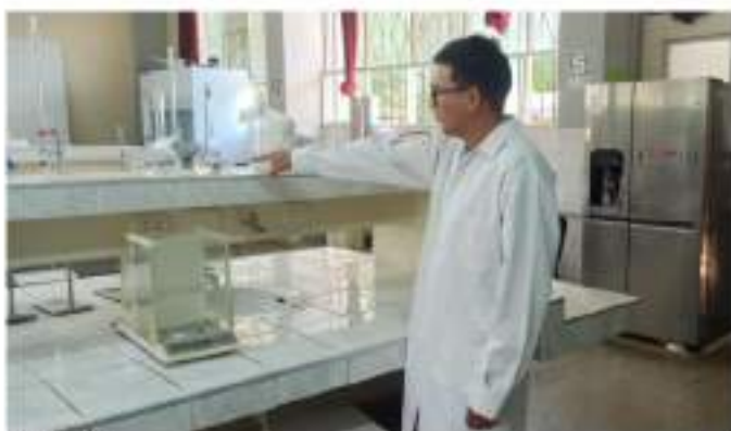
Figura 10 Verificación de materiales