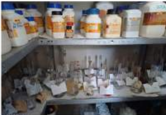
Figura 8 Estante de reactivos y materiales