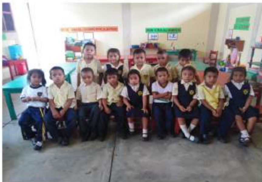
Niños y niñas de la sección "Amor" de la edad de 4 años de la I.E.I N° 160