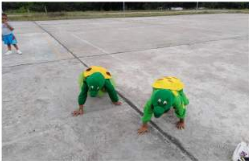
Niños y niñas dramatizando un cuento "La tortuguita que aprendió a controlarse" expresando con claridad sus ideas y utilizando un tono adecuado de voz.