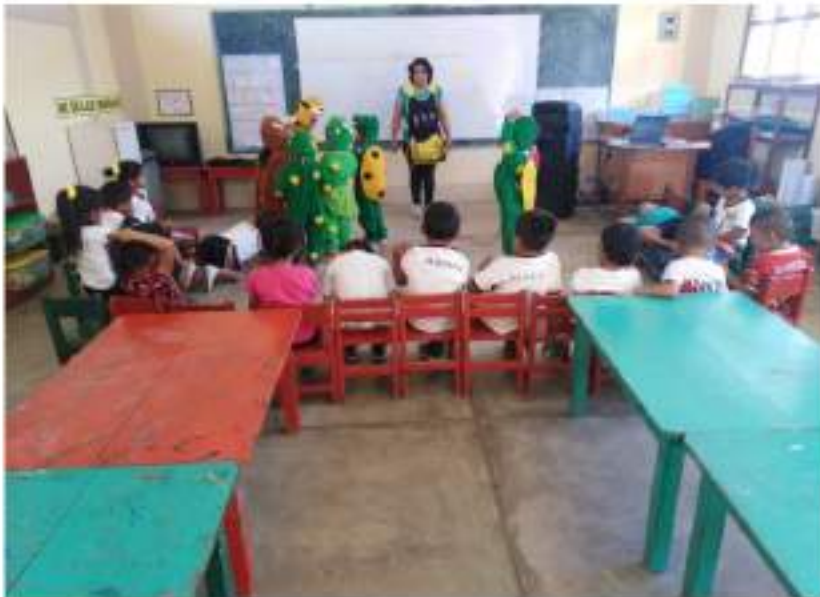
Niños y niñas dramatizando un cuento "Los animales de la selva" expresando con claridad sus ideas y escuchando atentamente cuando alguien habla.