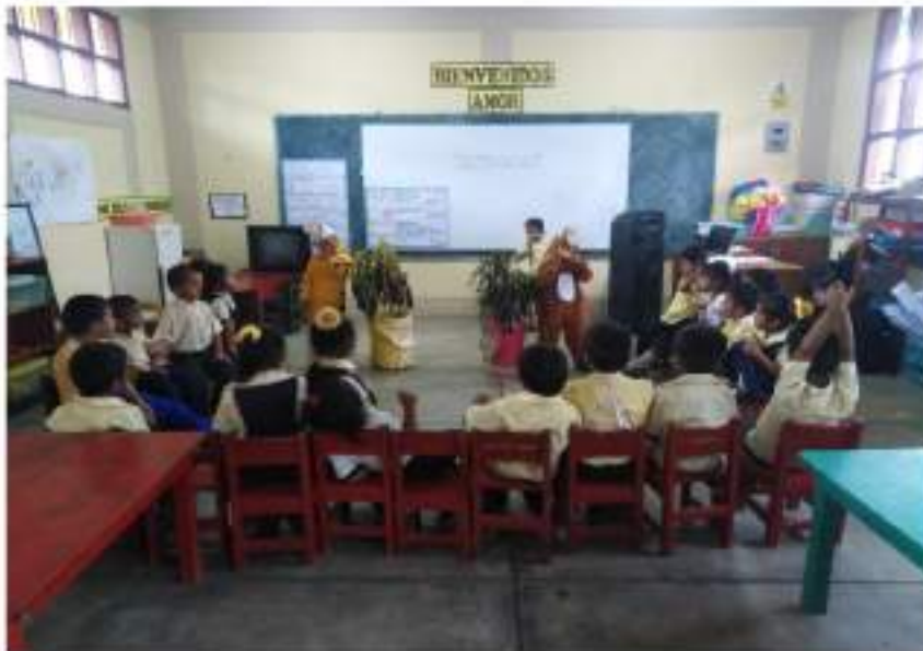
Niños y niñas dramatizando un cuento "El tigre y el mono bailarín" utilizando un adecuado tono de voz según los personajes que caracterizan y una correcta postura del cuerpo.