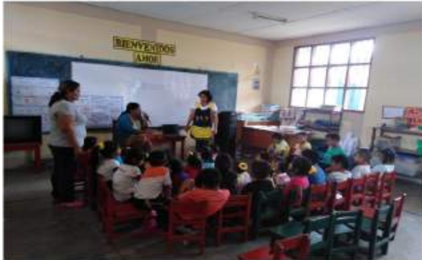
Niños y niñas escuchando cuentos propios de la comunidad narrados por una pobladora de la comunidad.