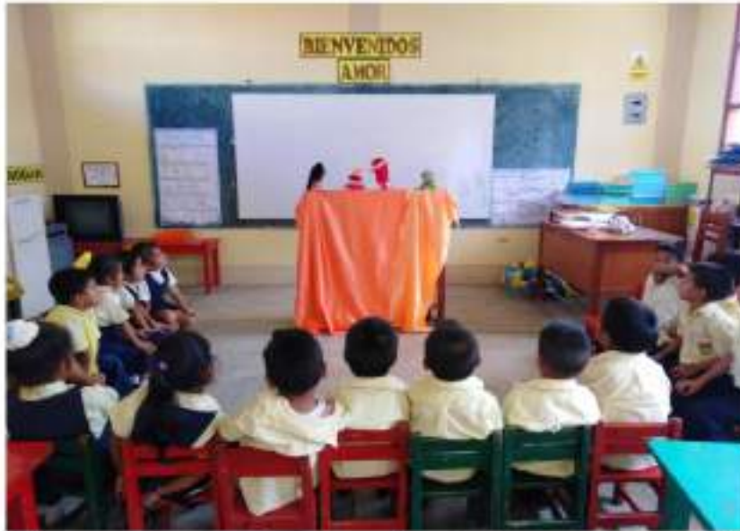
Niños y niñas dramatizando un cuento con títeres "Amigos por siempre" con una buena dicción y respondiendo preguntas.