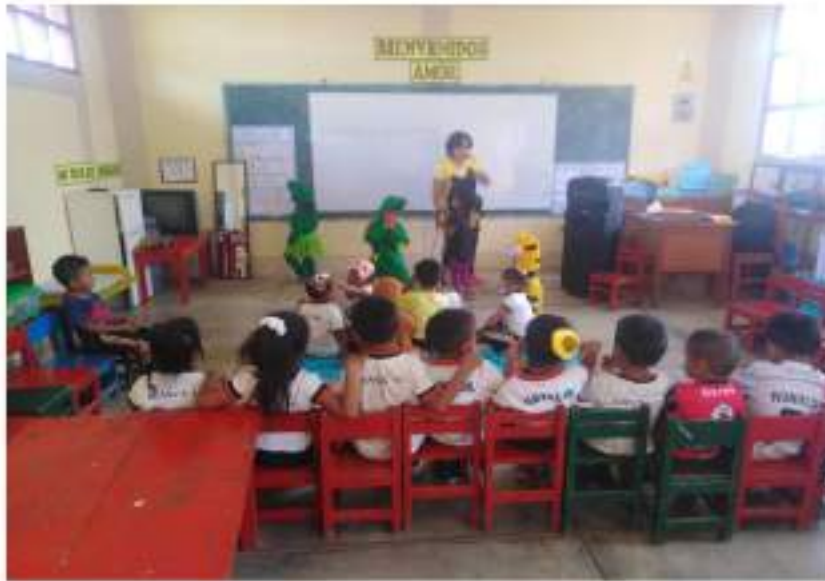
Niños y niñas dramatizando un cuento "El sapito Chico" utilizando una correcta postura, expresando con claridad sus ideas y utilizando un adecuado tono de voz.