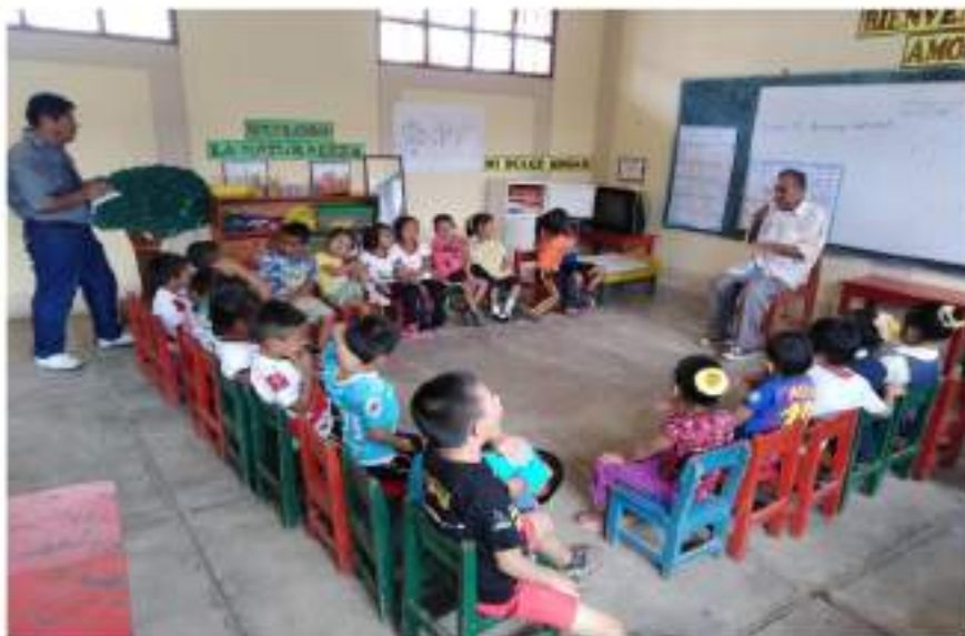
Niños y niñas escuchando cuentos propios de la comunidad, narrados por el sabio de la comunidad, para luego ser dramatizado.