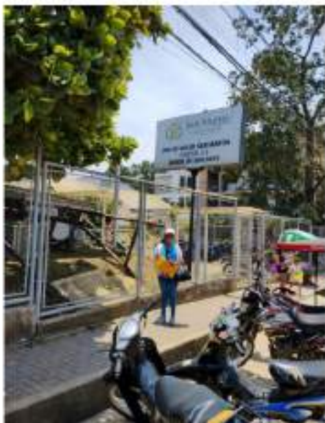
Figura 3 Microrred Banda de Shilcayo