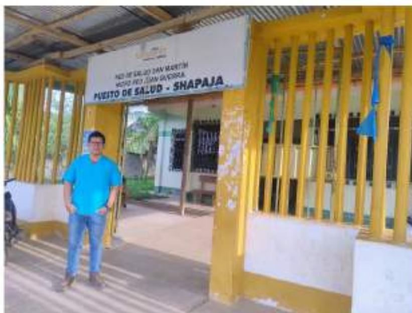
Figura 14 Puesto de Salud Shapaja