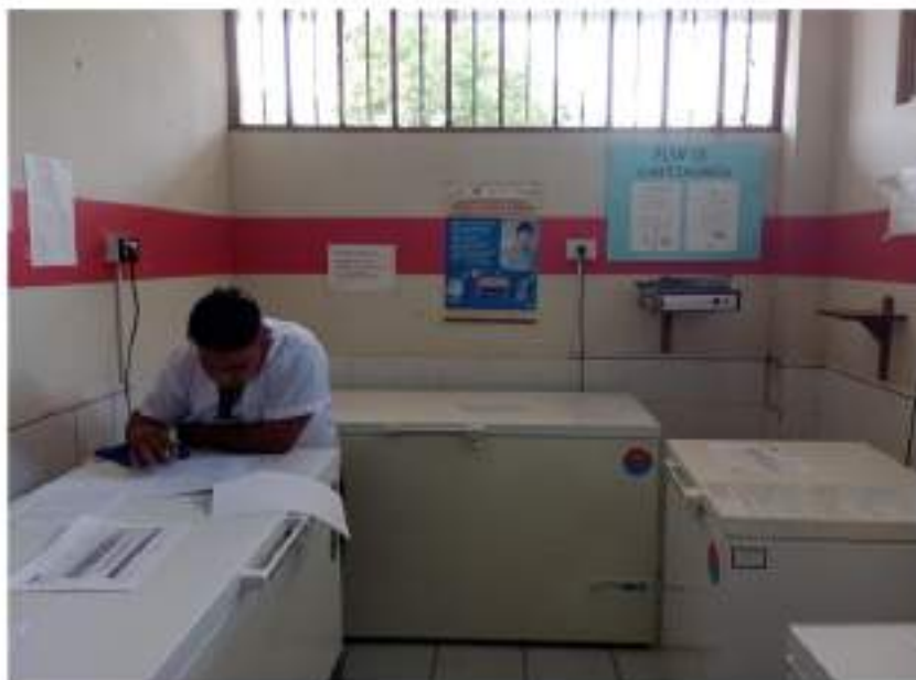
Figura 6 41 Cadena de Frío Puesto de Salud San Antonio de Cumbaza