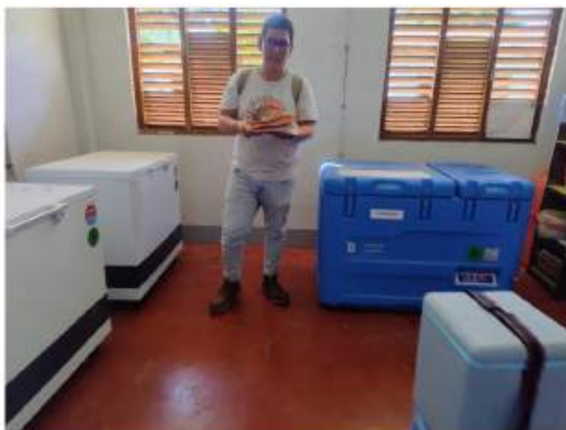
Figura 8 Cadena de Frío Puesto de Salud Huimbayoc