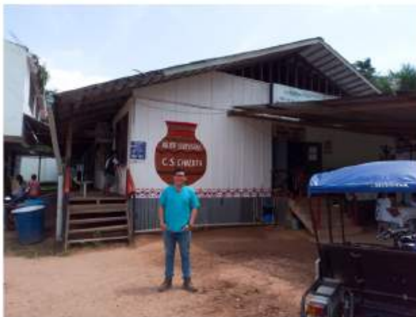
Figura 12 Centro de Salud Chazuta