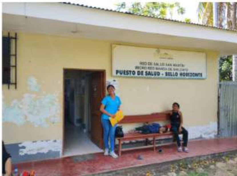
Figura 5 Puesto de Salud Bello Horizonte