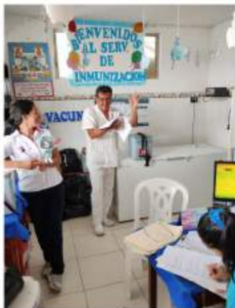
Figura 4 Microrred Morales