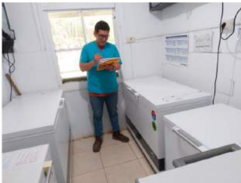
Figura 10 Cadena de Frio Puesto de Salud Aguanomuyuna