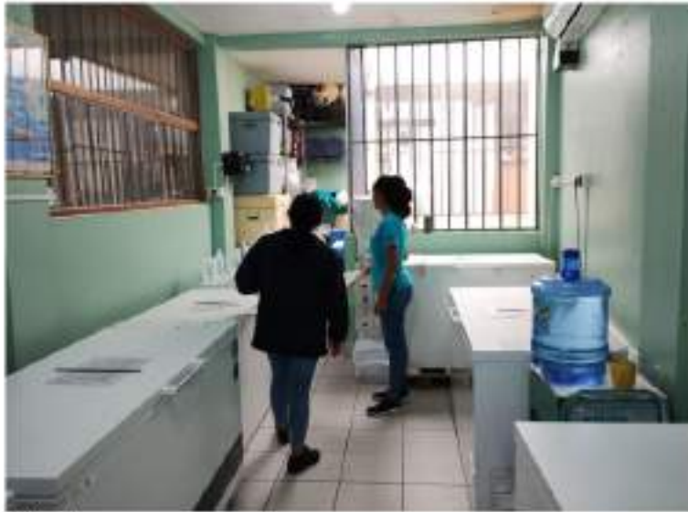
Figura 1 Cadena de Frío Centro de Salud Nueve de Abril