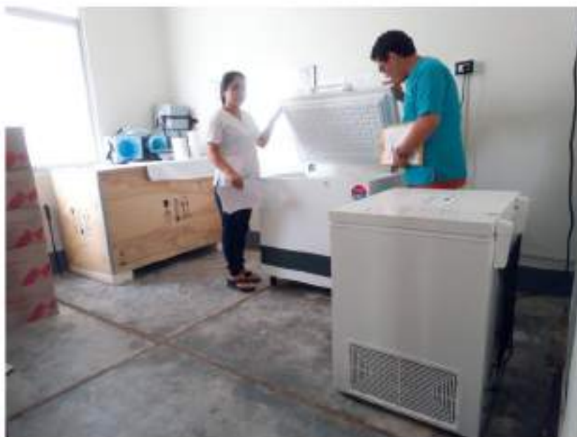
Figura 13 Cadena de Frío Puesto de Salud Dos de Mayo