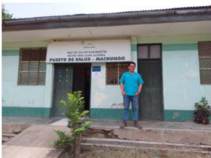
Figura 7 Puesto de Salud Machungo