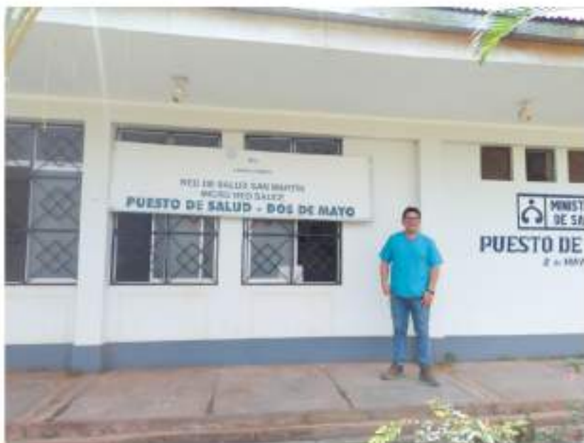
Figura 9 Puesto de Salud Dos de Mayo