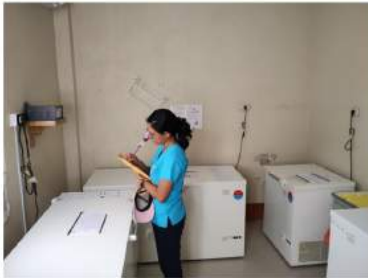
Figura 2 Cadena de Frío Microrred Juan Guerra