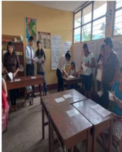
Fotografía3,4: Padres y madres de familia resolviendo el cuestionario de tiempo parental dedicado a los hijos.