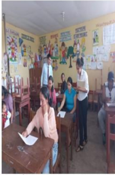
Fotografía2: Padres y madres de familia desarrollado el cuestionario sobre el tiempo parental.