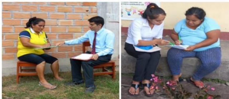
Fotografías 11, 12: Visita a los hogares y aplicación el cuestionario de tiempo parental dedicado a los hijos.