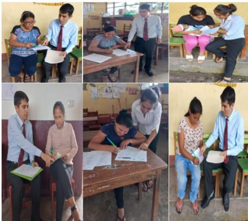
Fotografías 5,6,7,8,9,10: Madres de familia desarrollando el cuestionario de tiempo parental dedicado a los hijos.