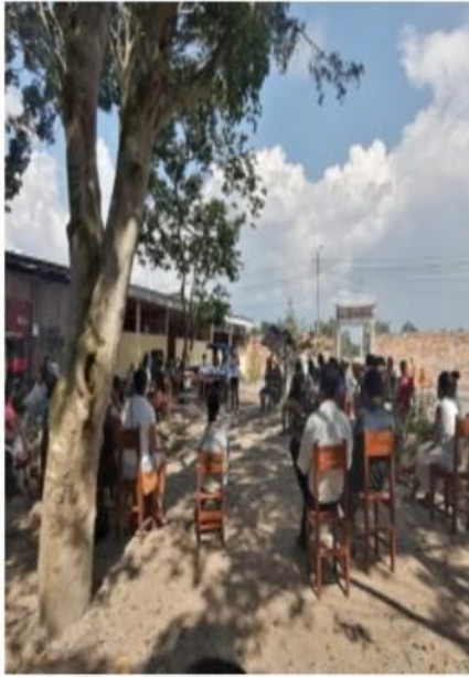
Fotografía1: Explicación y aplicación de cuestionario sobre el tiempo parental dedicado a los hijos.