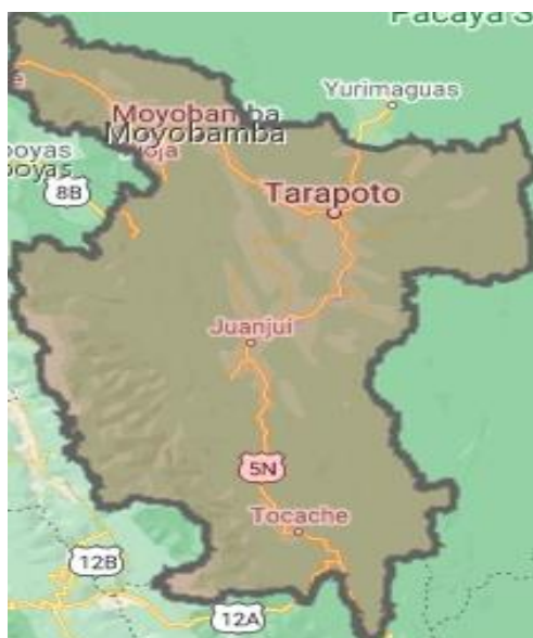
Figura 1. Ubicación geográfica de la región San Martín

Históricamente fue creado por ley 201 el 4 de setiembre de 1906, anteriormente formaba parte del departamento de Loreto, luego pasó a ser un departamento independiente, con su capital Moyobamba por ser antigua. Actualmente tiene 10 provincias.